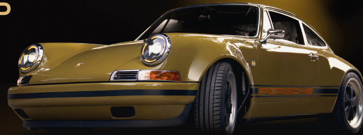
LAB OLIVE 2023

Lab Eleven ricrea il fascino delle mitiche Porsche d'epoca attraverso un restyle in chiave retro. Oltre che i componenti rispettati in ogni minuzioso dettaglio, tessuti vintage, e un look moderno grazie a componenti tecnologiche all'avanguardia, la 911 assume i connotati di un gioiello senza tempo.