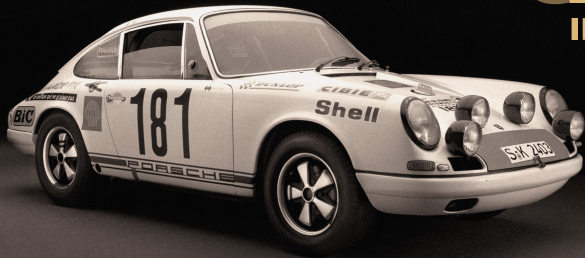
PORSCHE 911 R 1967